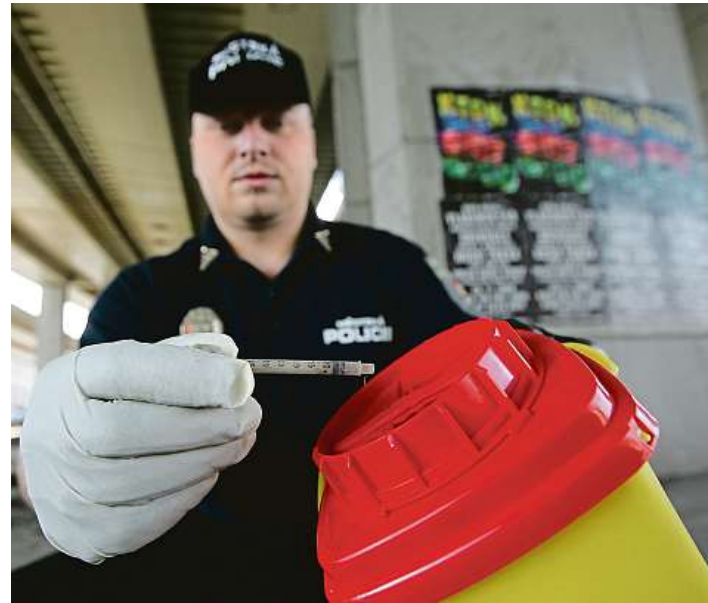
Sběr stříkaček Použité injekční stříkačky a jehly sbírají pravidelně ve městech i strážníci.

Ředitel doplňuje, že ve skutečnosti je pravděpodobnost nákazy žloutenkou či virem HIV malá. „Ty viry přežívají v nějakém ideálním prostředí, ničí je vysoký mráz nebo naopak velké horko. Záleží také na imunitě člověka. Avšak ani odborníci nedokáží přesně říci, jak velké procento nalezených jehel může