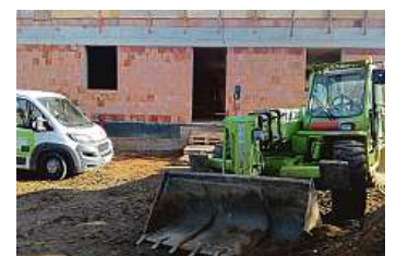
Stavba Alzheimer centra je nahrubo hotová.

„Naše náklady na provoz centra odhadujeme asi na dva miliony korun